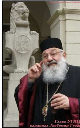
Глава УГКЦ кардинал Любомир Гузар

За рік, від минулого Великодня, відбулося багато змін в економічній, політичній і соціальній сферах суспільства в усьому світі та, зокрема, в Україні. Така мінливість нашого буття може нас налякати і знеохотити. Однак щорічне святкування найбільшого в літургійному році празника Христового Воскресіння нагадує нам, що на протигагу нестабільності подій нашого земного життя слід поставити те, що Боже, яке є тривалим і незмінним. І ця правда дає нам підставу для нашої віри і надії.